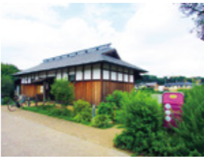
農業ふれあい公園

省エネを進め、まちなか発電や、友好都市との連携により再生可能エネルギーを増やし、原発に頼らない社会を武蔵野市から築いていきます。脱原発首長会議に参加します。農地の保全や公園の拡大等により、緑を増やし、武蔵野市の環境を守ります。農業公園を新設し、市民が農に触れる機会を増やします。雨水浸透を進めて、井の頭池の湧水復活をめざします。