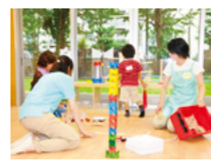
おもちゃのぐるりん

未だ保育園待機児童ゼロは実現できていません。子どもと子育てをまちぐるみで応援することは武蔵野市の将来にとってとても大切なことです。保育園待機児童ゼロと保育の質の確保、幼稚園の入園補助金の増額、18歳までの医療費無料化、さらには、中高生世代にも目を向けた総合的な子ども政策を進めます。