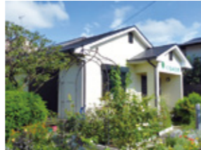
テンミリオンハウスくるみの木

武蔵野市の全世帯の約半分にあたる3万7000世帯がひとり暮らしです。そのうちの高齢者のひとり暮らしは、約8000世帯。病気になったり、仕事を失ったりして困ったときは、市が支え、コミュニティのみんなで助け合って、ひとりでも安心して暮らせるまちをめざします。地域包括ケアを進め、在宅でも24時間365日、介護と医療が受けられる安心のケアコミュニティを創出します。国の介護保険制度後退に対し、きちんと意見を言い、市独自で介護の質を支えます。地域ケアと連携した特別養護老人ホームを増設します。若い世代の貧困と向き合い、就労支援や居場所づくりを行います。