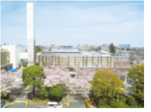
武蔵野クリーンセンター

市長退職金3分の1と市長交際費の大幅縮減をにつけ、予算の無駄遣いを許しません。今後30年にわたる都市基盤設備（小・中学校校舎、下水道等）のリニューアルを着実に実行します。健全な財政を活かして、市民提案の新規事業の予算化に取り組みます。