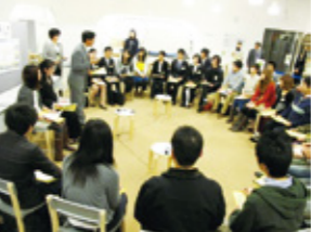
タウンミーティング

第6期長期計画を多くの市民参加でつくり、策定した計画による施策の評価に市民が参加できる制度をつくります。