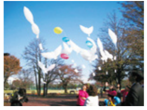
武蔵野市平和の日

男女平等推進条例を活用し、女性の権利を守ります。LGBTへの理解を進め、パートナーシップ証明書を発行します。障がいの有無にかかわらずスポーツを楽しめるようにします。武蔵野プレイスの成果を全市に活かします。11月24日の武蔵野市平和の日を中心に市民とともに平和事業を行い、日本国憲法を大切にすることを進めます。